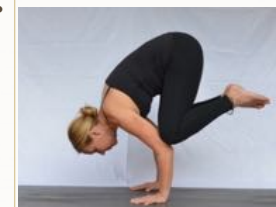
„Bakasana“ , die Krähe

Du kannst mich gerne für jegliche Fragen kontaktieren.