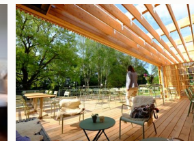
Terrasse und Garten